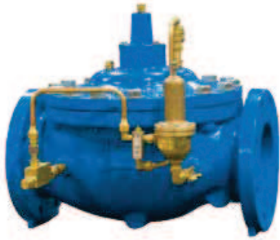
106-PR Tipo Globo